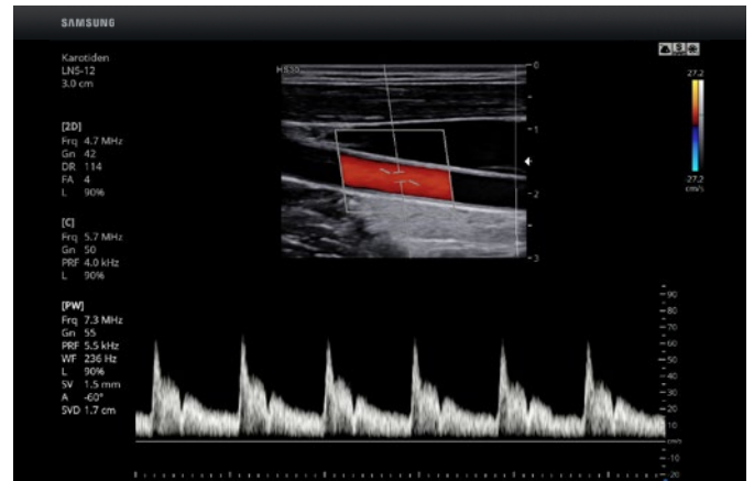
A. carotis communis im PW-Doppler