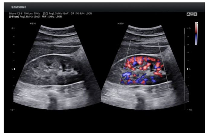
Niere im Dual Live